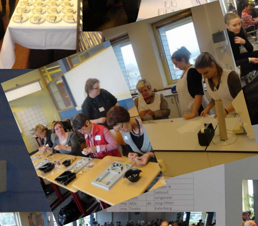
Workshop 5 Nestkastjes maken