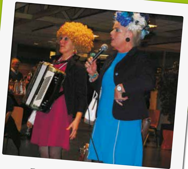
Een mooi en enthousiast optreden van de trevird's