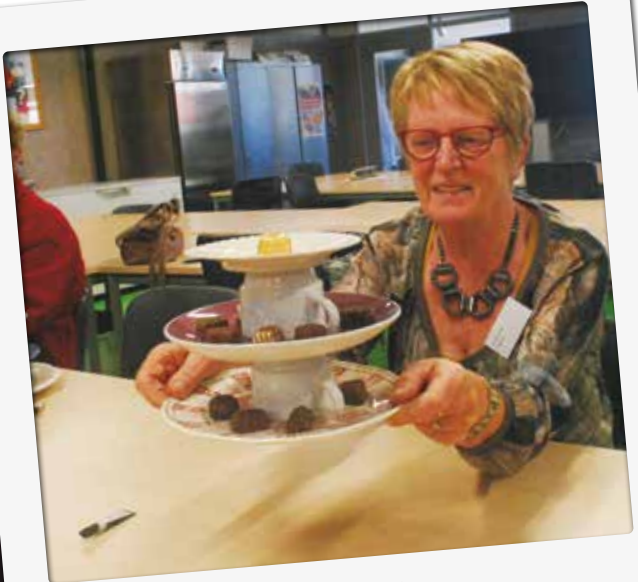
Er werden creatieve workshops gegeven