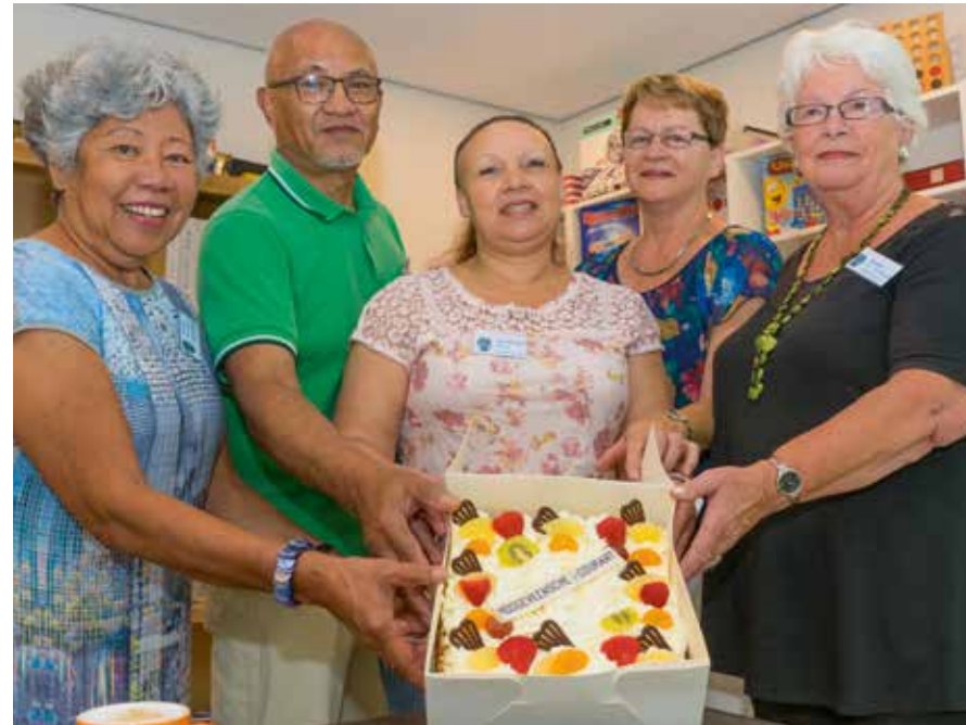
De Taart van de Week ging in september jl. naar de vrijwilligers van de dementheek.

Per 1 juli 2016 is het Ontmoetingscentrum & Dementheek Hoogeveen verhuisd naar de NNZC locatie Wolfsbos. Het Ontmoetingscentrum & Dementheek is op 15 september jl. op de nieuwe locatie heropend.