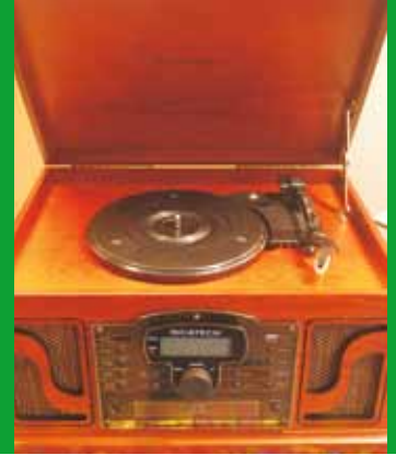
Het nostalgisch muziekcentrum

Gouwe Ouwe – een kreet uit de tijd van de piratenzenders. Radio Veronica en Radio Noordzee, commerciële radiozenders aan boord van schepen die buiten de territoriale wateren voor anker lagen. Een Gouwe Ouwe was een voormalige hit-single, die het volgens de diskjockey waard was om voor de vergetelheid behoed te worden.