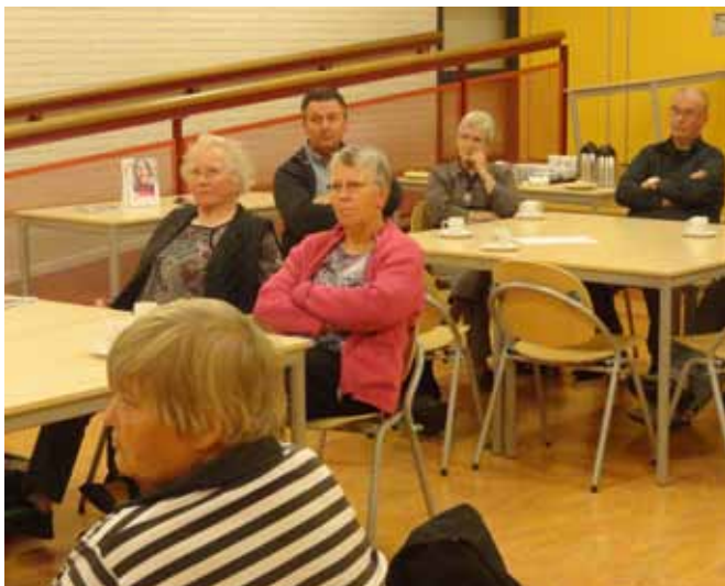
Belangstellend luisterende mantelzorgers

Buiten Achmea vergoeden de meeste zorgverzekeraars haar werkzaamheden. Op het budget voor ondersteuning wordt vaak geknepen terwijl de vraag zal toenemen. Ze zal dan ook in alle gevallen altijd de goedkoopste oplossing bieden. Als alles is afgehandeld en geregeld, draagt ze de voortgang van de betreffende mantelzorger weer over aan de plaatselijke consulent. Haar regio strekt zich uit over de noordelijke provincies.