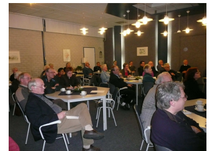
Ruime belangstelling voor het thema 'Mantelzorg en Financien'. Nadere info in deze Nieuwsbrief.