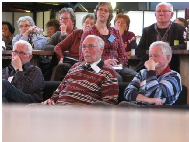
Serius luisterend publiek