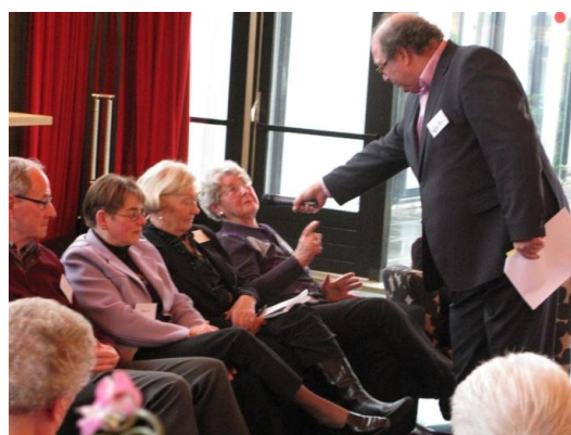
Voorzitter betreft mantelzorg in het debat