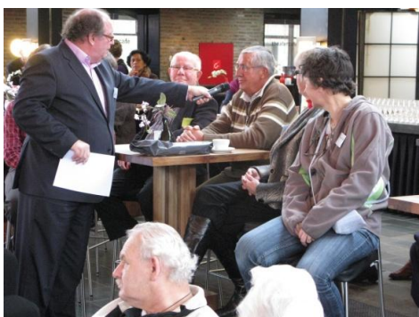
Mantelzorg wordt geïnterviewd