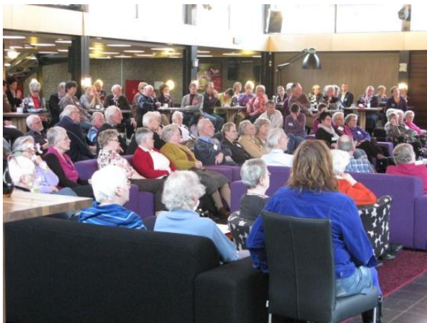
Een druk bezochte foyer van De Tamboer