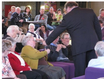
Niemand ontliep de microfoon