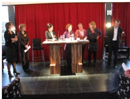
Twee 2-kamerleden (links) en lokale politici in debat